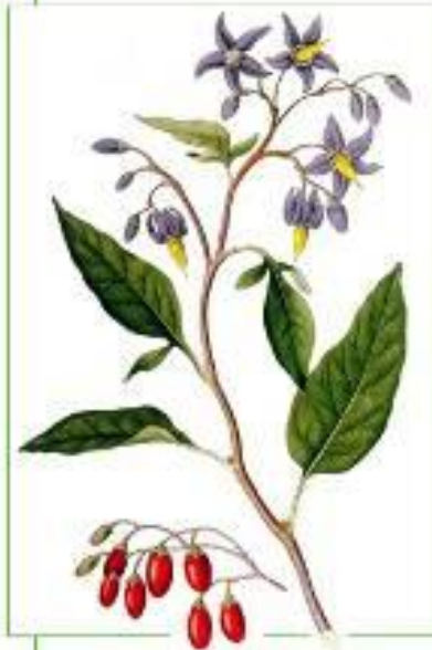
Паслен сладко - горький