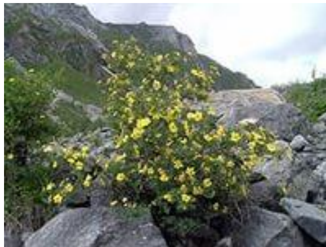
лапчатка (курильский чай)