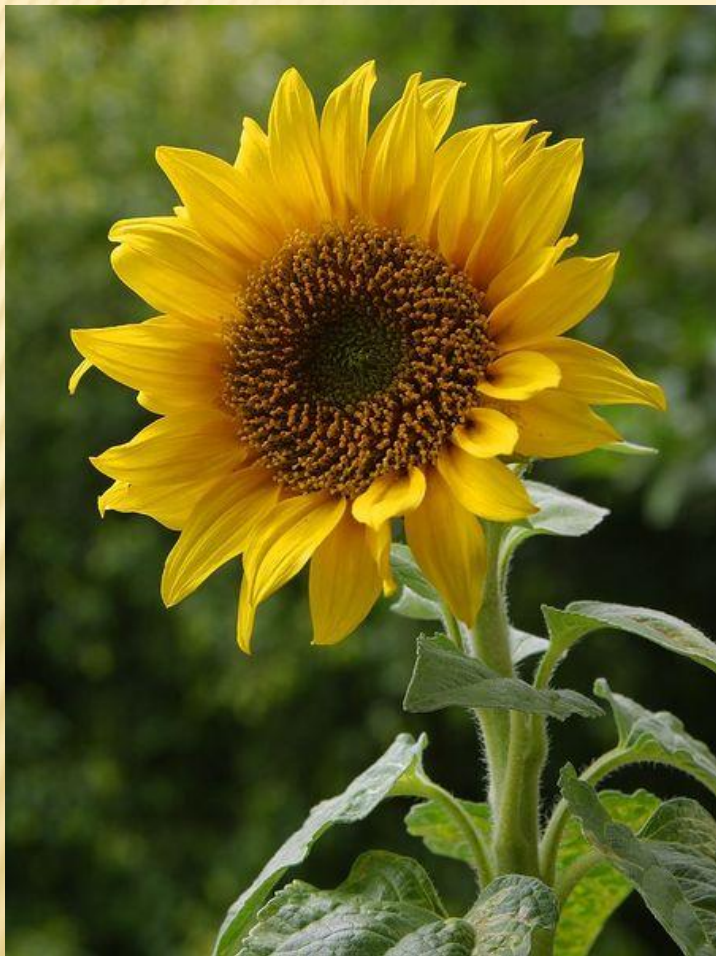
ПОДСОЛНЕЧНИК «Солнечный цветок»