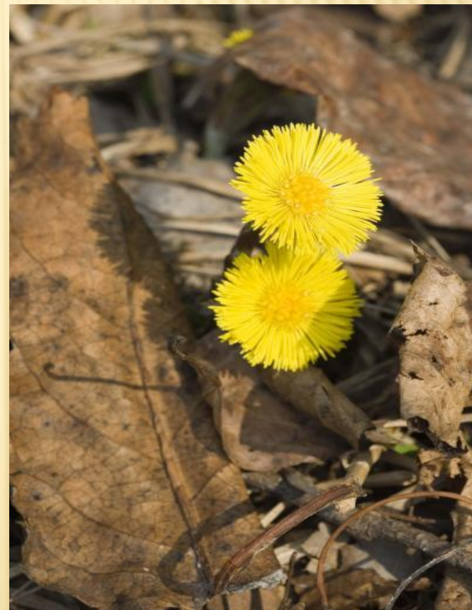
Мать- и- мачеха