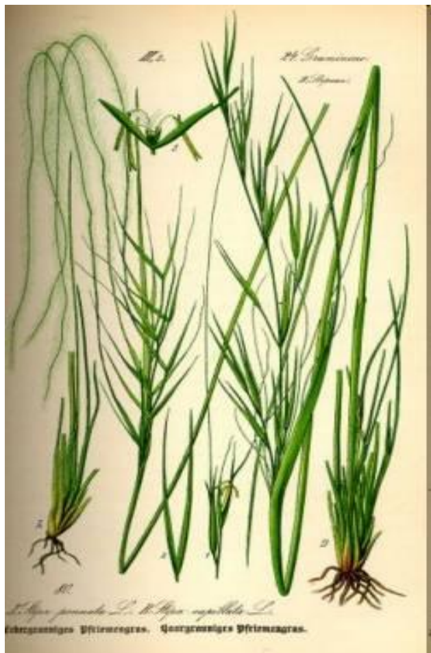
Слева: (А) Ковыль перистый; (В) Ковыль... http://www.tsvetnik.info/dry/stipa.htm

Кроме полевых культур, к семейству злаков относят дикорастущие травы, например пырей ползучий, тимофеевку луговую, ковыли.