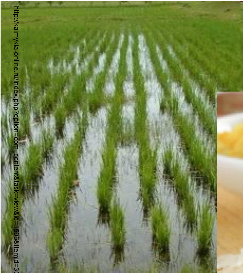
Рис - ценная зерновая культура. Его выращивают в южных районах на поливных землях.