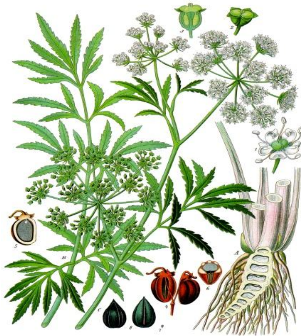
Cicuta virosa L.