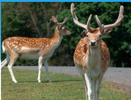
Благородный олень (марал, изюбр)