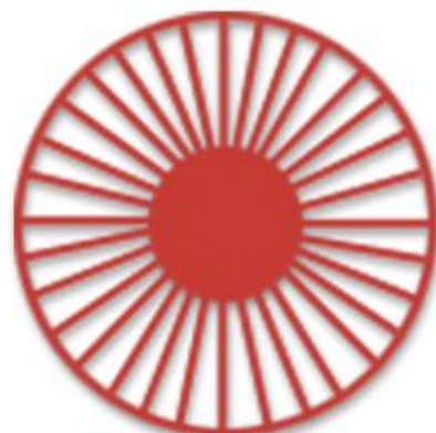
Строение шляпки снизу