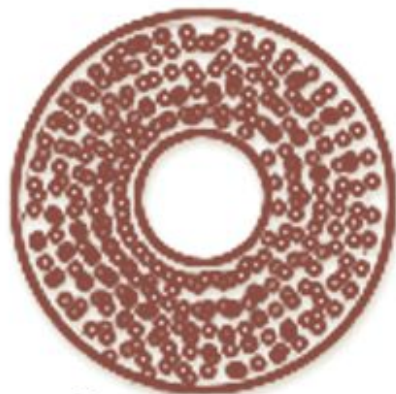
Строение шляпки снизу