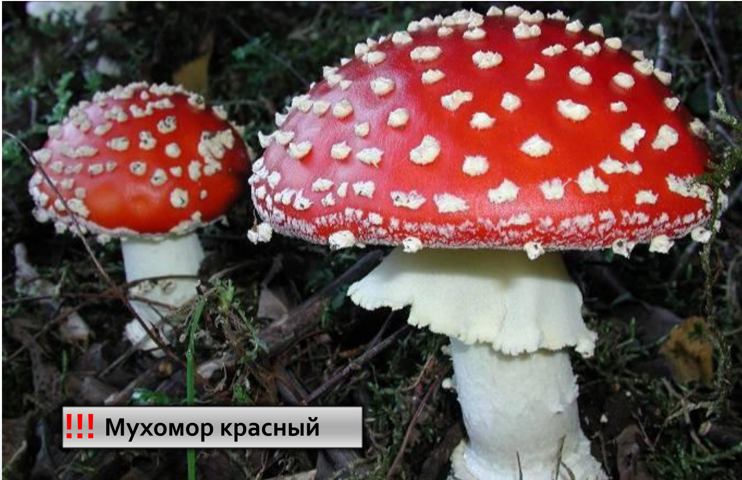
!!! Мухомор красный

Красивый, ярко окрашенный гриб. Встречается летом и осенью в лиственный и смешанных лесах.