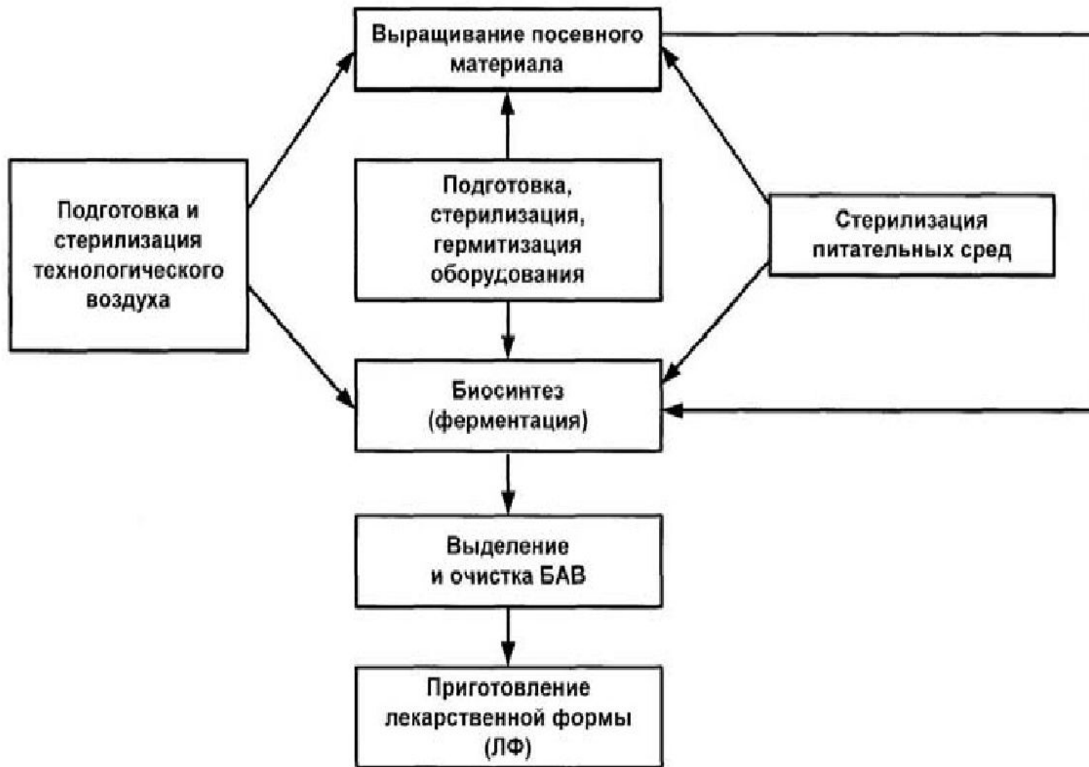
Схема производственного биотехнологического процесса