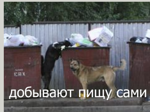
добывают пищу сами