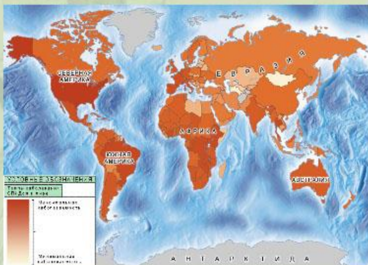
Карта распространения СПИДа в мире.