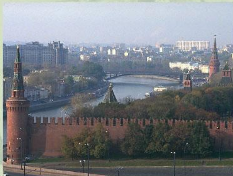
Кремль - сердце Москвы.

Подробнее узнать о истории строительства Великой Китайской стены и Московского Кремля, об их архитектуре и современном состоянии вы сможете, прочитав статьи в Энциклопедии.