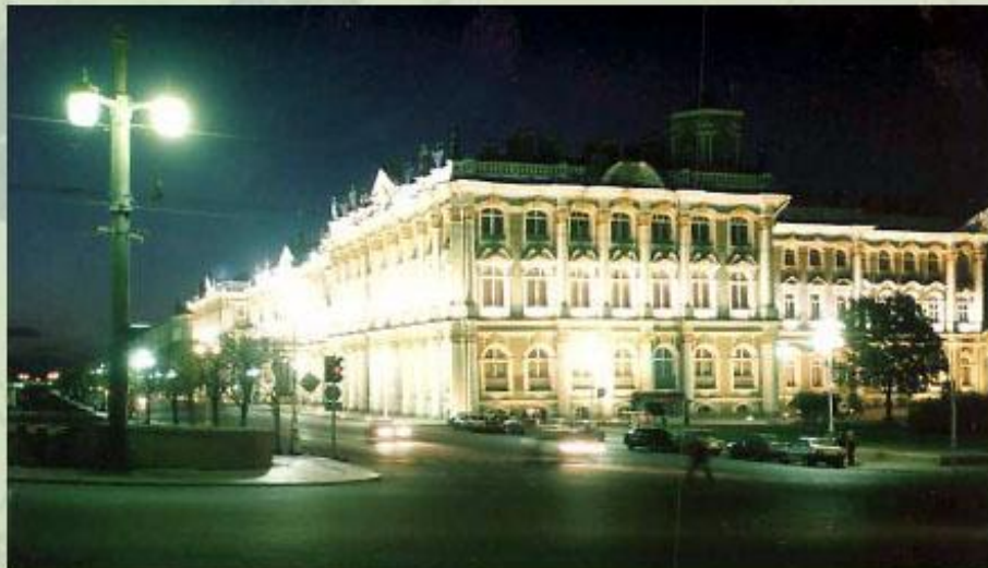
Эрмитаж - один из величайших музеев мира.