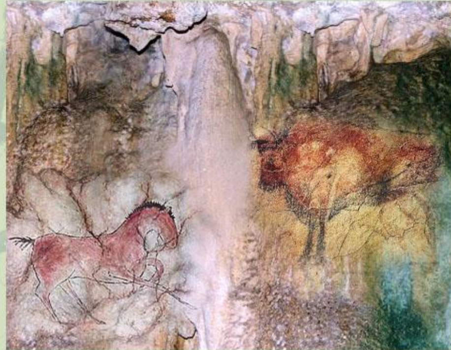
Наскальный рисунок древних людей.

Росписи на камнях и стенах пещер, пирамиды Древнего Египта, каменная обсерватория Стоунхендж, греческий Акрополь, Великая китайская стена, Московский Кремль и дворцы Санкт-Петербурга, статуя Свободы, столица Бразилии, театр в Сиднее - таковы важнейшие вехи в культурном развитии человечества, признанные шедеврами человеческой культуры. Ежегодно ученые многих стран мира открывают новые шедевры, которых уже сегодня насчитывается более 500.