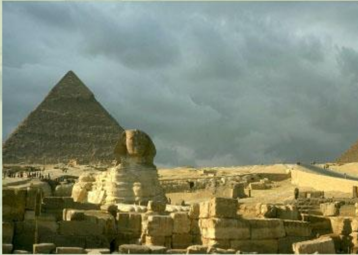
Пирамиды Древнего Египта.