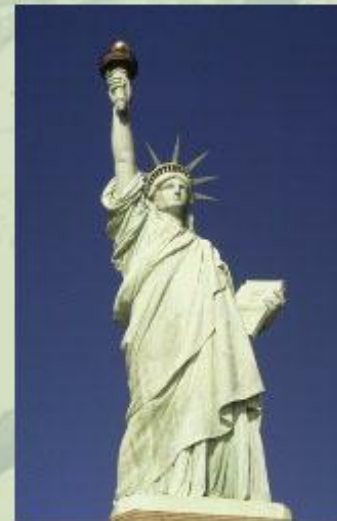
Статуя Свободы - символ США.

Эрмитаж в Санкт-Петербурге - бывший императорский дворец, а сейчас - один из крупнейших и известнейших музеев мира. Подробнее о нем вы сможете узнать в статье Эрмитаж .