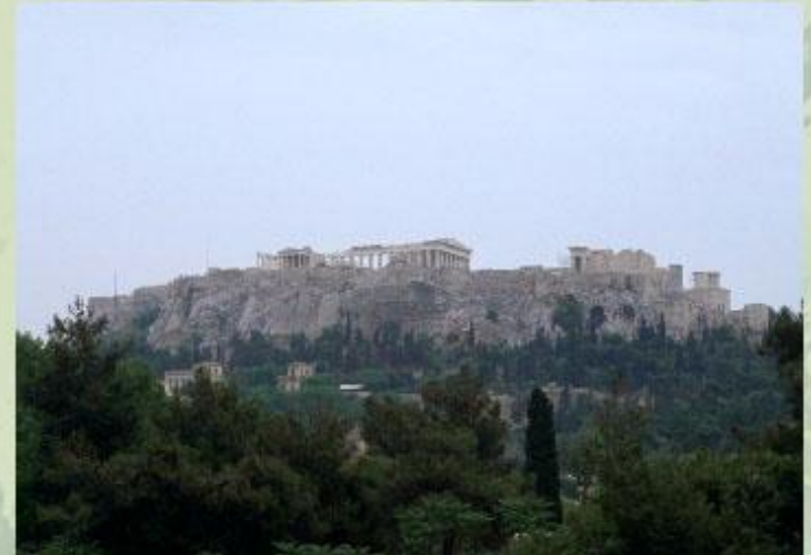
Афинский Акрополь - шедевр античной архитектуры.

Узнать об одном из древних «семи чудес света» - египетских пирамидах - вы сможете из статьи Египетские пирамиды .