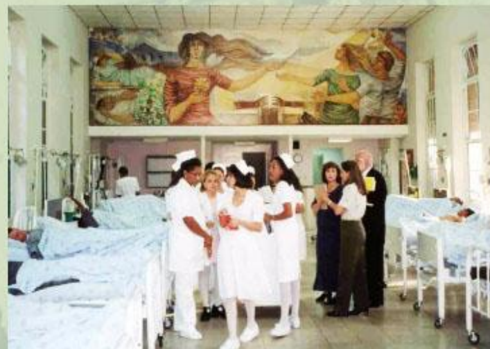
Современная больница в одной из развивающихся стран.

Увеличение продолжительности жизни населения, улучшение качества питания, снижение уровня заболеваемости - характерная черта многих стран современного мира. Однако в ряде бедных стран Африки и Азии все еще распространены туберкулез и малярия, тысячи детей ежегодно умирают от столбняка. Массовой проблемой для всех стран мира является распространение СПИДа.