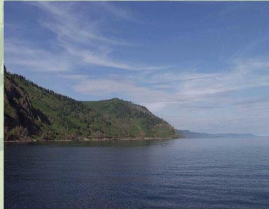
Байкал - глубочайшее озеро на Земле.

В ноябре 1972 года XX века ЮНЕСКО , обеспокоенная судьбой уникальных объектов природы и культуры, включила их в список Всемирного наследия - ведь они составляют достояние всего человечества! Памятники природы, вошедшие в список Всемирного наследия, составляют менее 20% от общего их количества. Особенно много их в Северной Америке, Австралии и Новой Зеландии. В числе известных природных объектов - г. Джомолунгма , Большой Каньон Колорадо , Большой Барьерный риф , оз. Байкал .