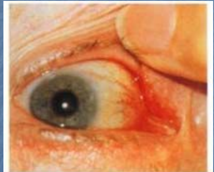
Рис. 17. Каналикулит, вызванный актиномицетами.