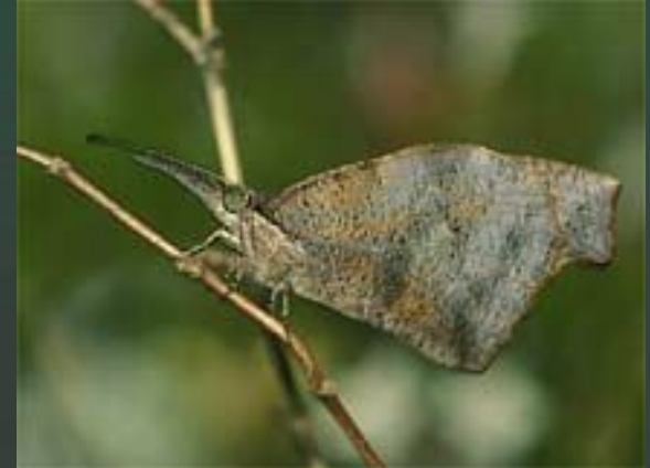
Горбатка напоминает шип; палочник – ветку; носатка листовидная – сухой лист