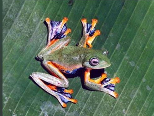
Японская летающая лягушка