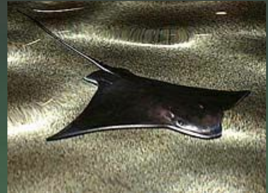
Водные организмы также имеют разную форму, в зависимости от образа жизни