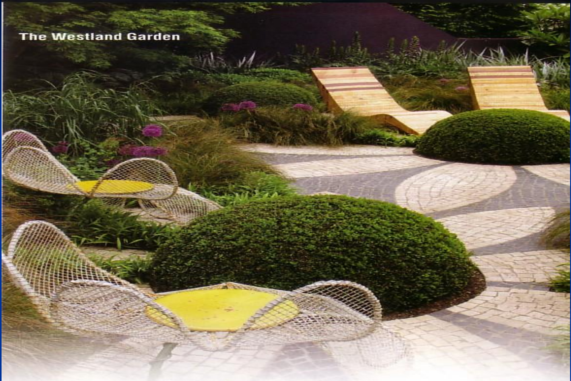
The Westland Garden