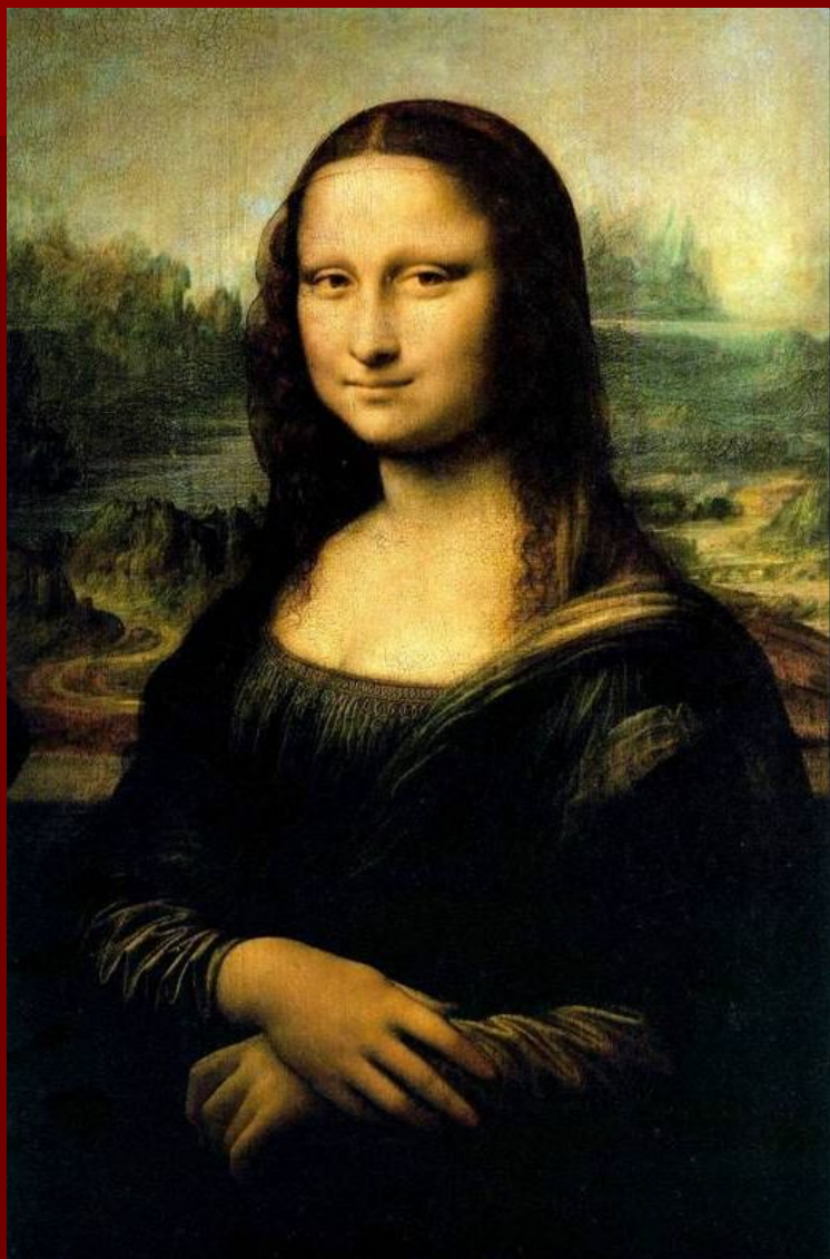
Леонардо да Винчи «Мона Лиза (Джоконда)»