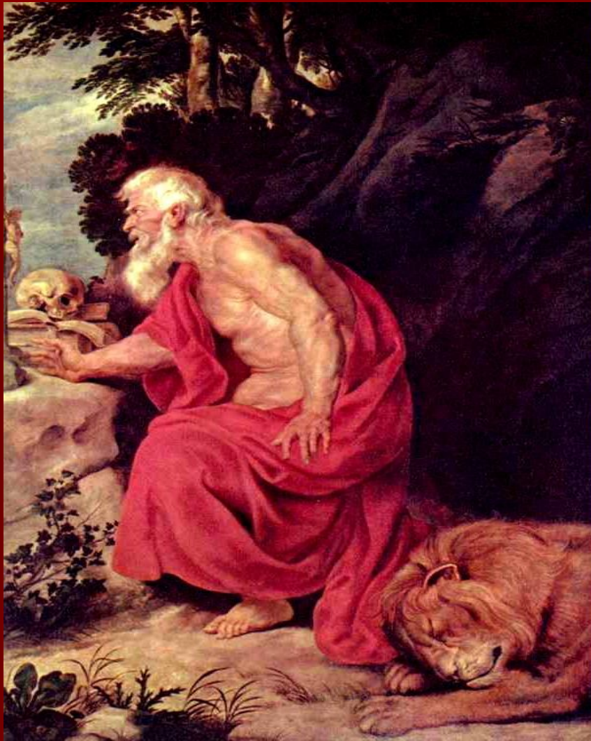
Петер Пауль Рубенс «Святой Иероним»