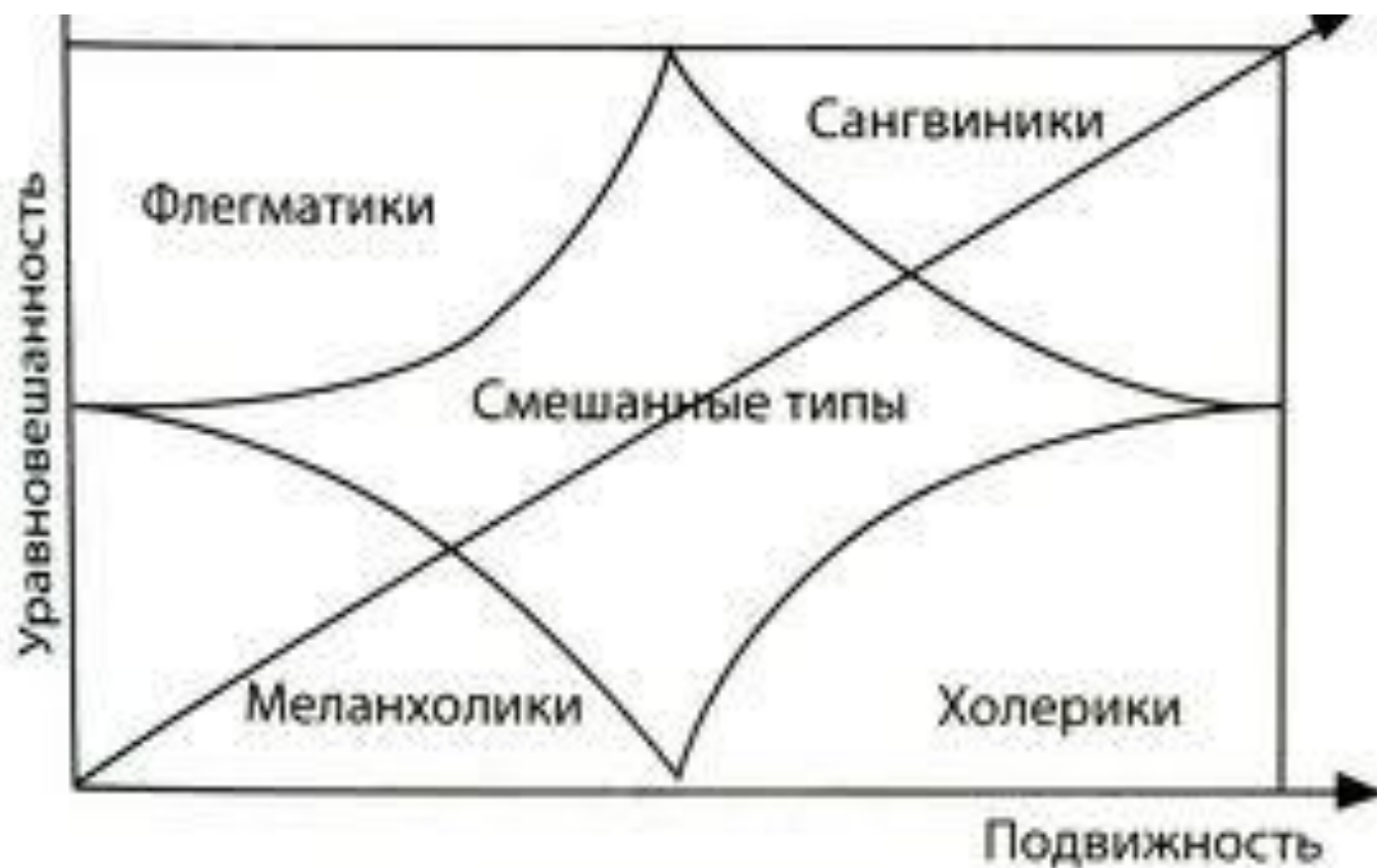
Рис. 4. Типы, черты человека