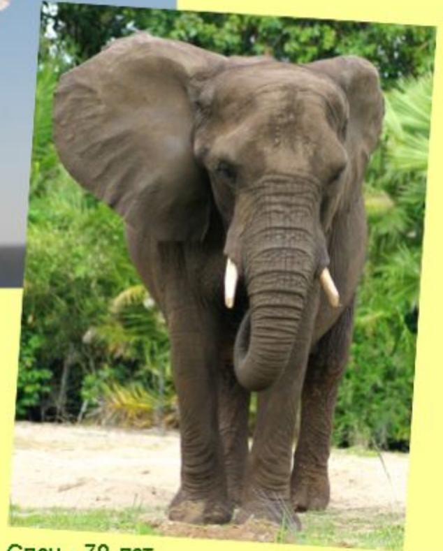
Слон - 70 лет