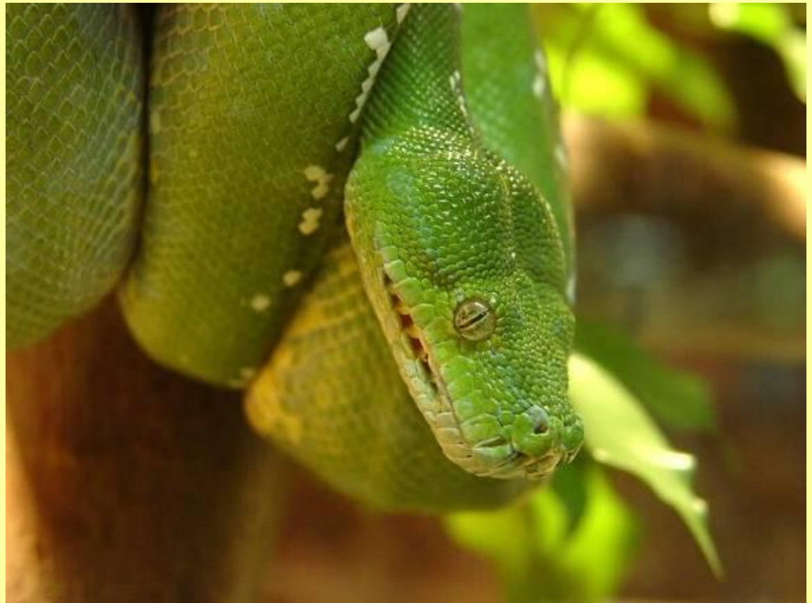
Зелёный древесный питон