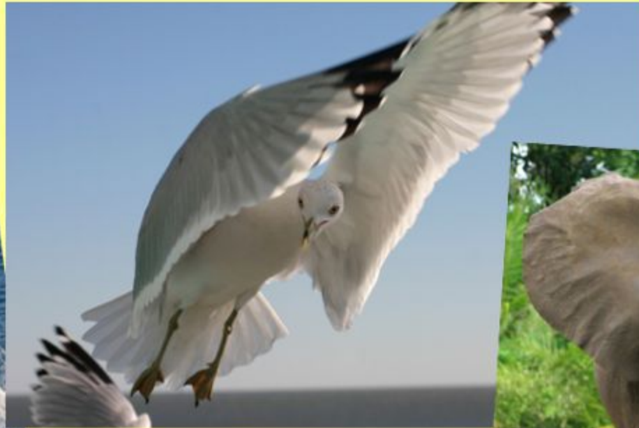
Альбатрос - 80-100 лет