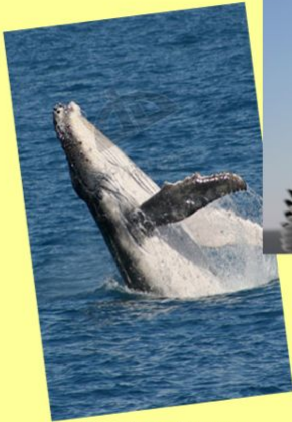
Кит - более 200 лет