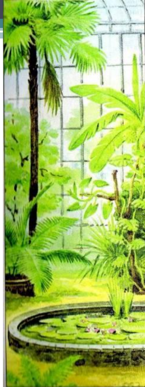
Рис. 21. Уголок оранжереи с тропическими растениями