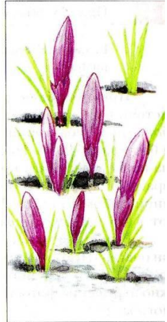
Рис. 16. Крокус, цветущий ранней весной