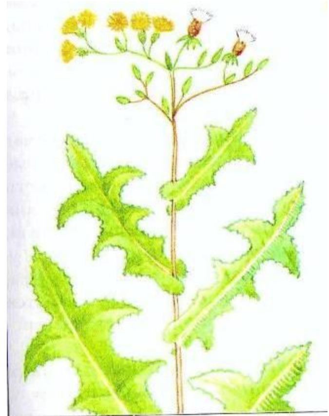
Рис. 17. Дикий салат – «компасное растение»