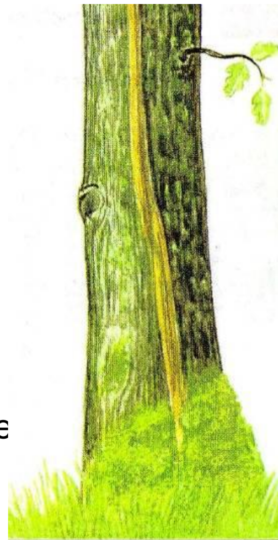
Рис. 20. Морозобойная трещина на стволе дуба