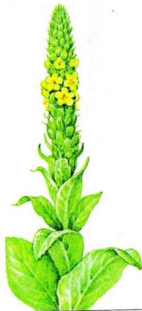
Рис. 18. Коровяк «медвежье ухо»