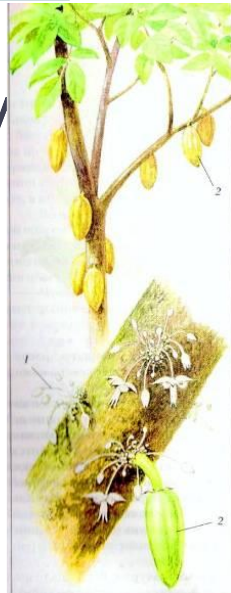
Рис. 19. Шоколадное дерево, или дерево какао, с цветками (1) и плодами (2)