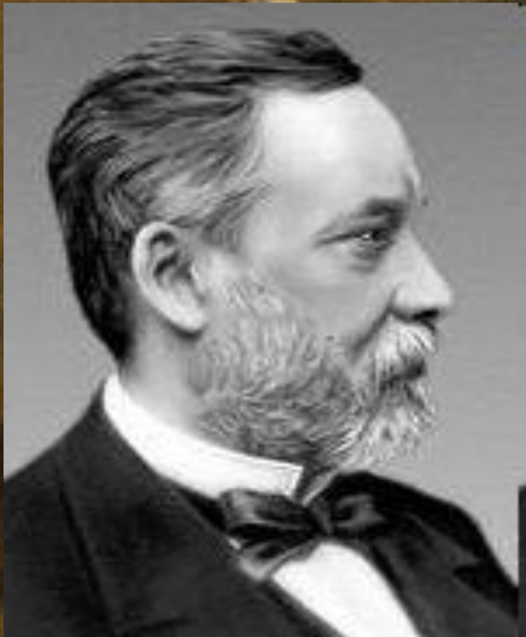
ЛУИ ПАСТЕР 1822 – 1895 Г

Опроверг возможность самозарождения живых существ в современных условиях.