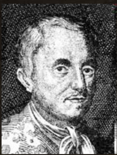
В. ГЕЛЬМОНТ 1579 – 1644 г

В. ГЕЛЬМОНТ придерживался виталистических представлений о том, что жизненные процессы якобы регулируются особыми «духами жизни» («археями»). В подтверждение в темный ящик поместил грязную рубашку, насыпал зерно, через три недели обнаружил – мышей. Человеческий пот – «активное» начало для зарождения жизни.