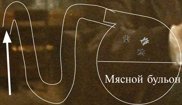
ОПЫТ Л. ПАСТЕРА