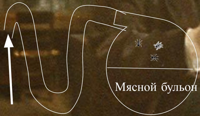
ОПЫТ Л. ПАСТЕРА