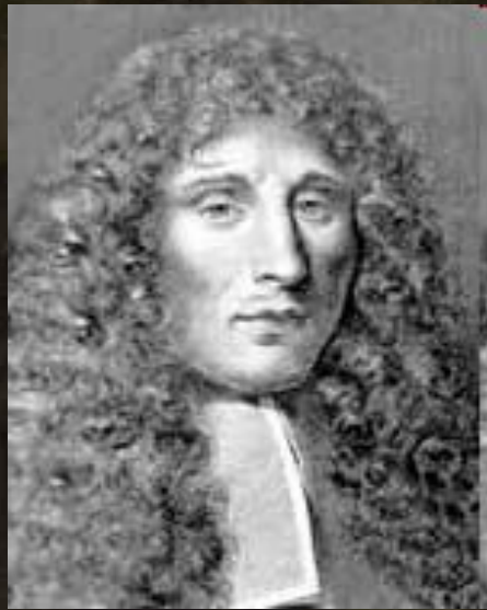
Франческо РЕДИ 1626 – 1698 г

В. ГЕЛЬМОНТ придерживался виталистических представлений о том, что жизненные процессы якобы регулируются особыми «духами жизни» («археями»). В подтверждение в темный ящик поместил грязную рубашку, насыпал зерно, через три недели обнаружил – мышей. Человеческий пот – «активное» начало для зарождения жизни.