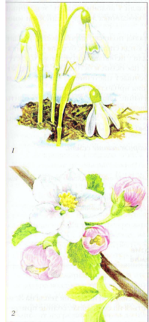
Рис. 13. Растения, цветущие весной: 1 – ранней (подснежник); 2 – поздней (яблоня)