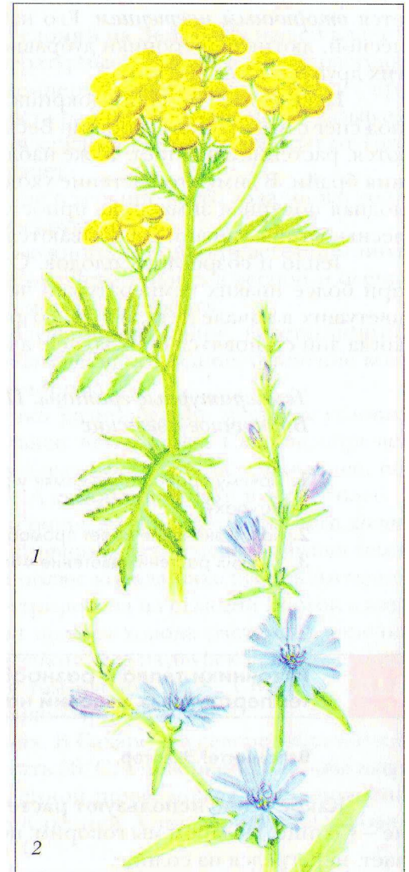
Рис. 14. Растения, цветущие летом: