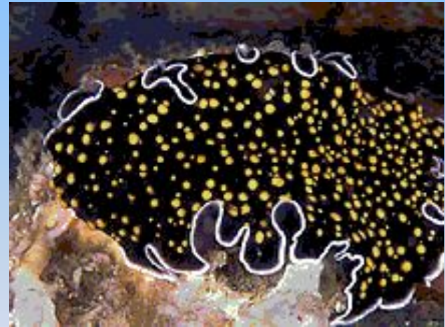
Архоофора Thysanozoon nigropapillosum.

Движение осуществляется как с помощью ресничек, так и в результате сокращения мускулатуры. При этом, ресничные черви способны не только ползать по субстрату, но и плавать.