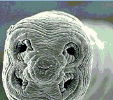
Сколекс крысиного цепня ( Hymenolepis diminuta ). Вид гельминтов класса цестод. Окончательные хозяева — крысы и мыши, промежуточные — насекомые. Паразитирует в тонкой кишке.

Жизненные циклы ленточных червей происходят в несколько этапов. На первом — взрослые черви, обитающие в тканях или органах основного хозяина, размножаются и продуцируют яйца. На втором — яйца попадают во внешнюю среду (почву или воду) и в них формируется личинка — онкосфера. Затем происходит попадание личинки в организм промежуточного хозяина. В результате внедрения в стенку кишечника, она попадает в кровяное русло и разносится током крови в различные органы. Здесь она превращается в покоящуюся стадию — пузырьчатую глисту, или финну. Для дальнейшего развития она должна попасть в организм основного хозяина. В его кишечнике под действием пищеварительных соков из финны выворачивается головка и паразит прикрепляется к стенке кишечника.