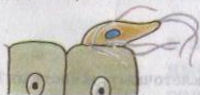
Лямблия на клетке кишечника