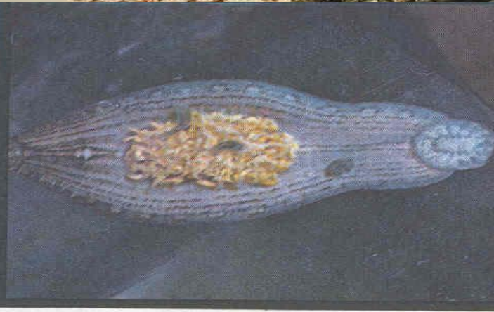
ПИЯВКИ НА ПИЯВКЕ