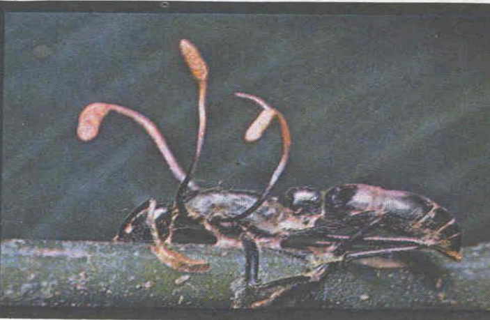
ГРИБЫ НА МУРАВЬЕ