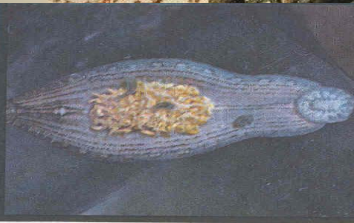
ПИЯВКИ НА ПИЯВКЕ