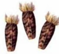
Плоды лопуха (репейника)