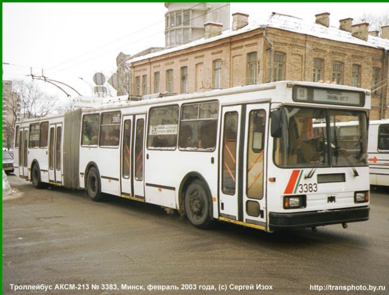
Троллейбус АКSM-213 № 3383, Минск, февраль 2003 года, (с) Сергей Изох