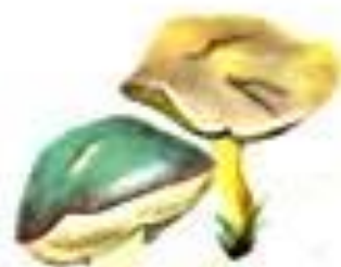
Моховик и колтуны