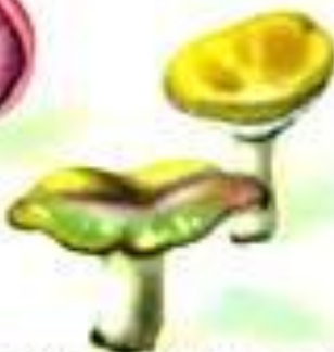
Сыроежка летняя, желтая, красная