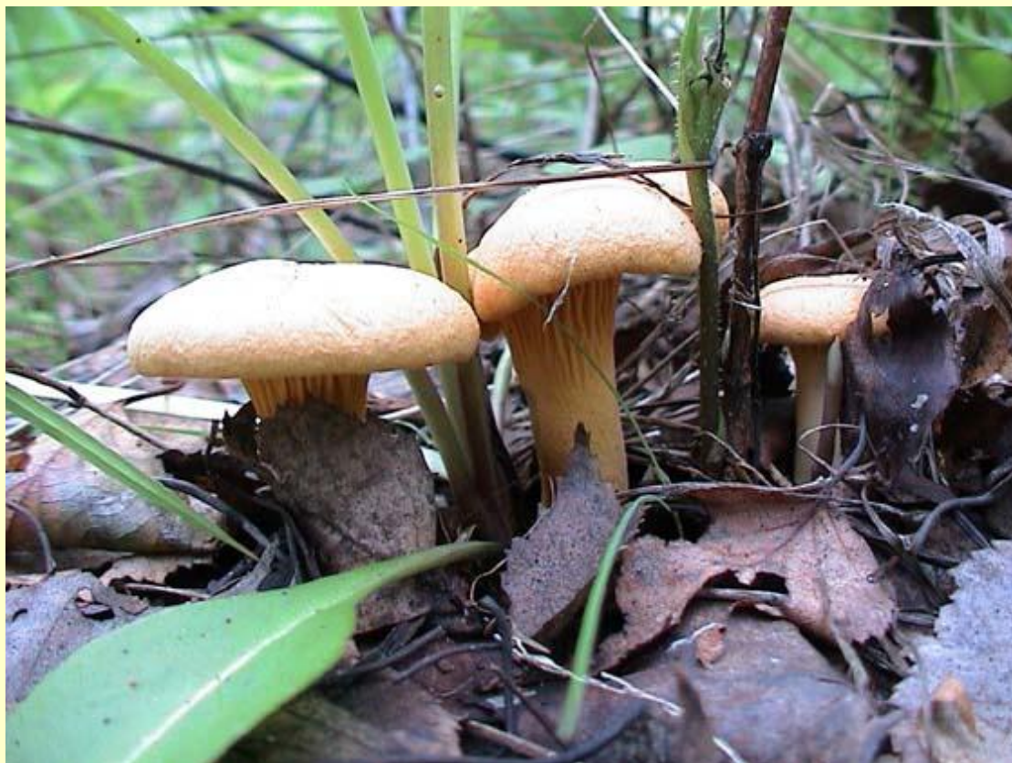
◆ Лисичка настоящая