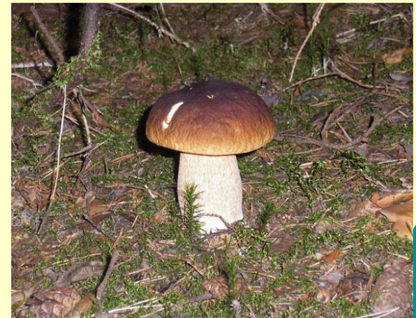
Белый гриб сосновый