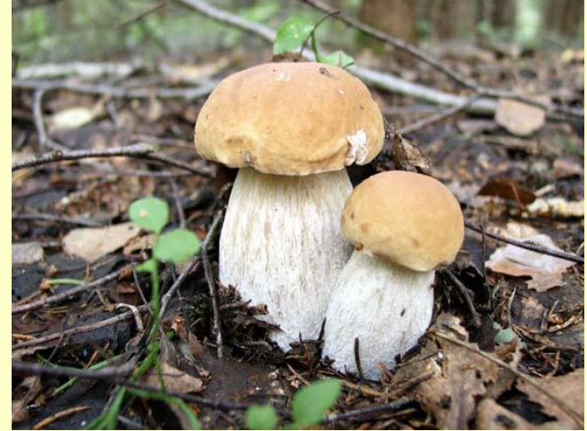
Белый гриб берёзовый