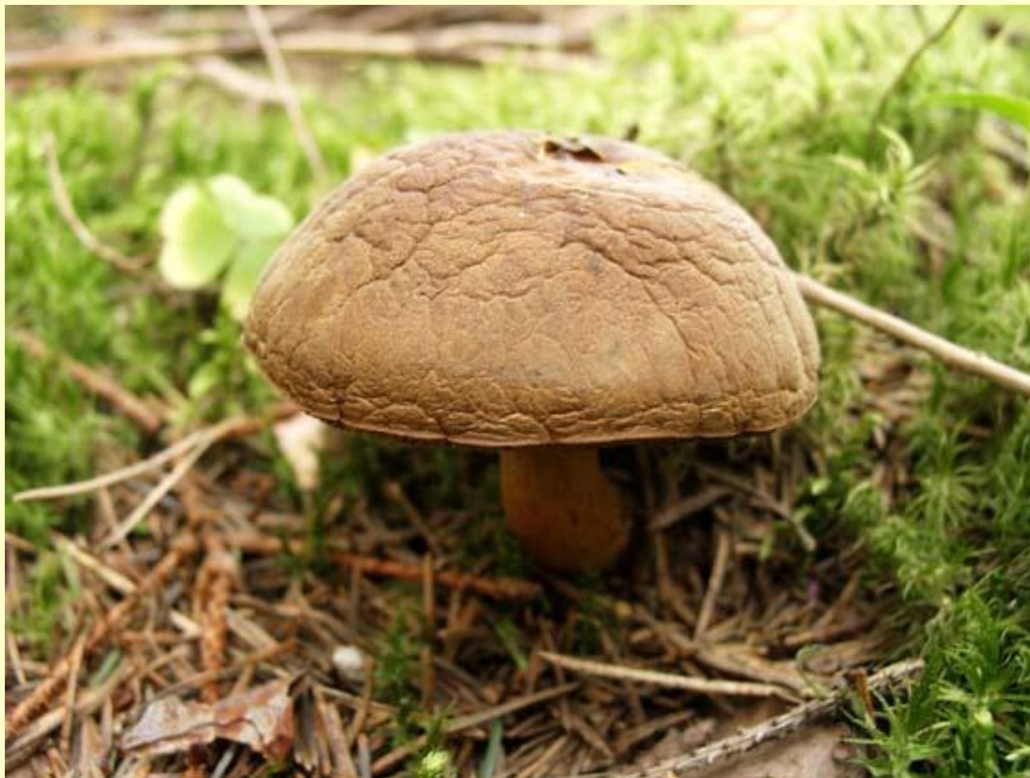
◆ Моховик зелёный