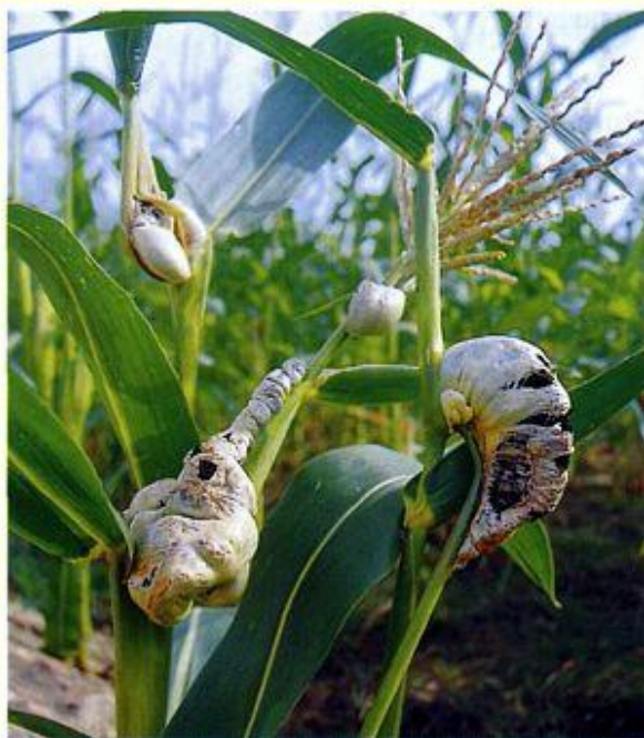
Початки кукурузы, пораженные головневым грибом