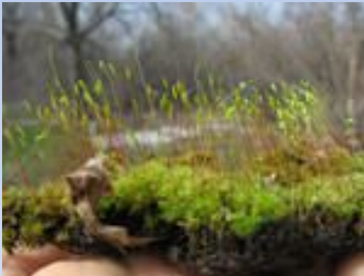
Зеленый мох Кукушкин лен