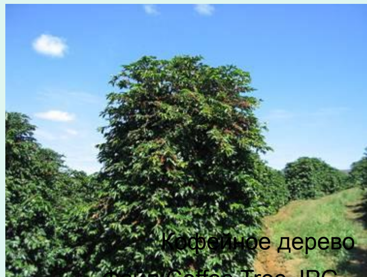
Кофейное дерево Файл: Coffee Tree.JPG

Твёрдая пшеница, ячмень, кофейное дерево, сорго, бананы.