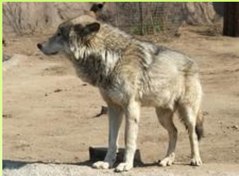
Волк в Московском зоопарке