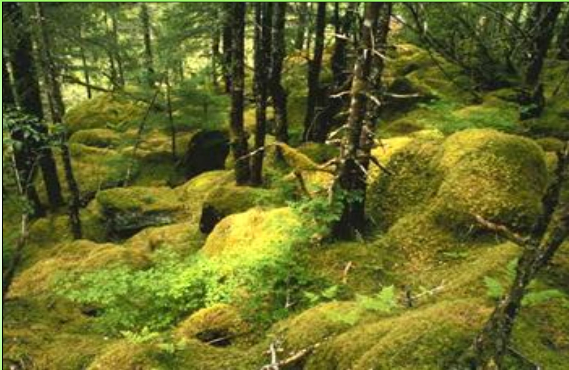
Моховой ковёр в лесу