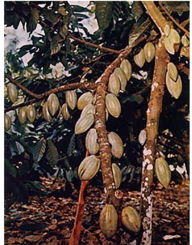
какао - плоды