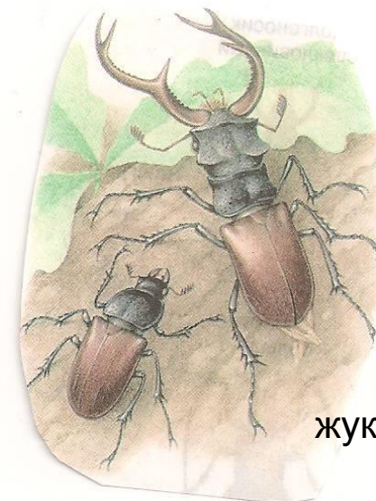
жук - олень