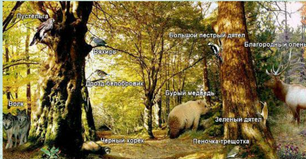
Экосистема - широколиственный лес.