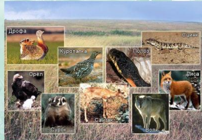
Экосистема - степь.

Важный признак совершенства экосистем - степень замкнутости оборота веществ . Это означает, что необходимые организмам вещества включены в круговорот и используются многократно.