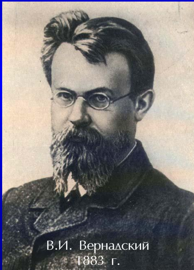
В.И. Вернадский 1883 г.