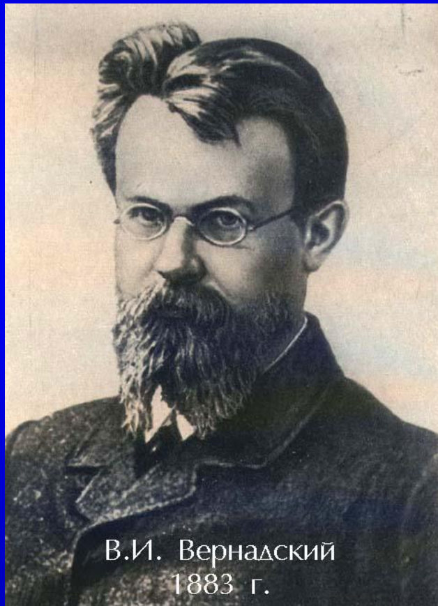
В.И. Вернадский 1883 г.