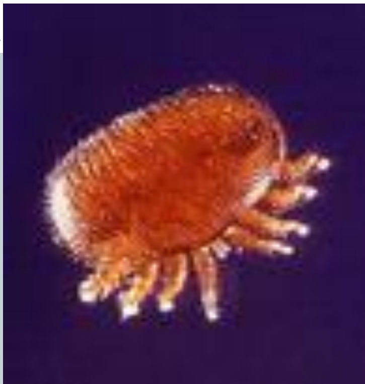
Клещ Варроа (самка)