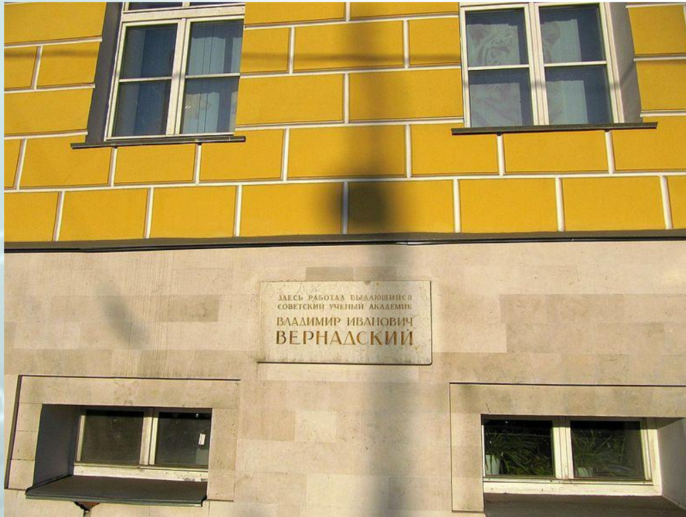
Владимир Иванович работал в МГУ

Вернадским опубликовано более 700 научных трудов.