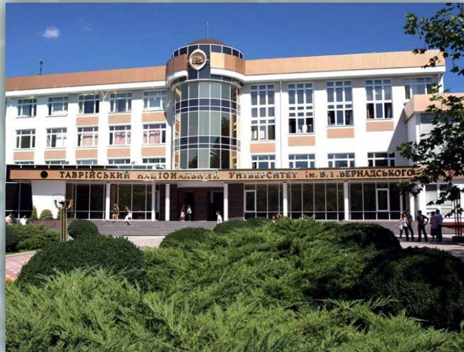
Таврический национальный университет им. В. И. Вернадского