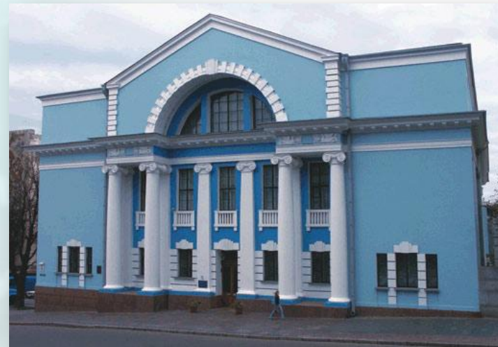
Украинская академия наук