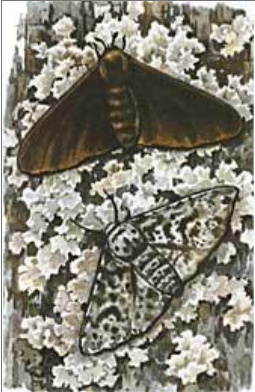
Индустриальный меланизм березовой пяденицы