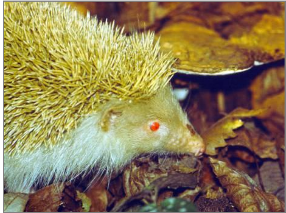
Альбинизм у ежа