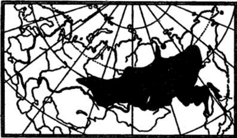
Ареал сибирской лягушки