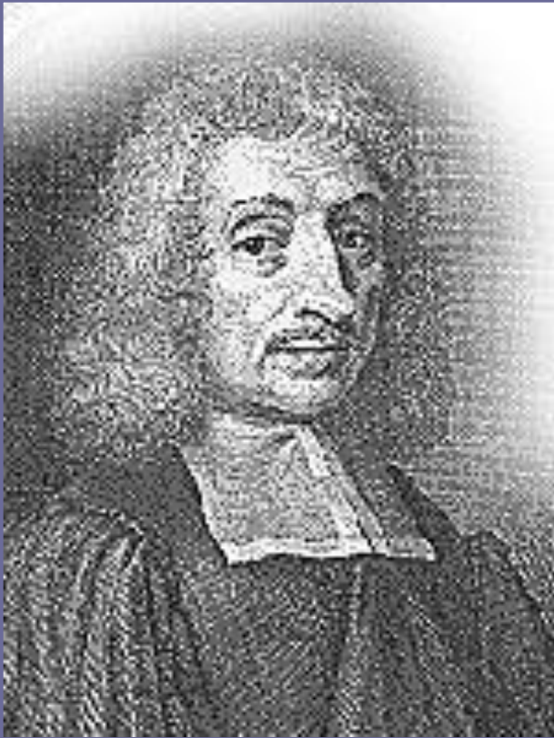
Джон Рей (1628 – 1705)

Термин «вид» впервые ввел в биологию английский ботаник Джон Рей.