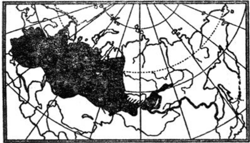
Ареал травяной лягушки