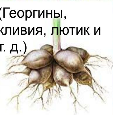
Корневые клубни (корневые шишки)