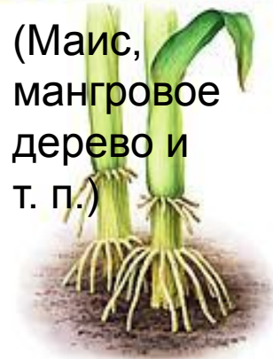
Ходульные корни (корни-подпорки)