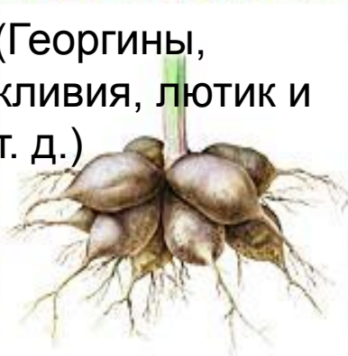
Корневые клубни (корневые шишки)