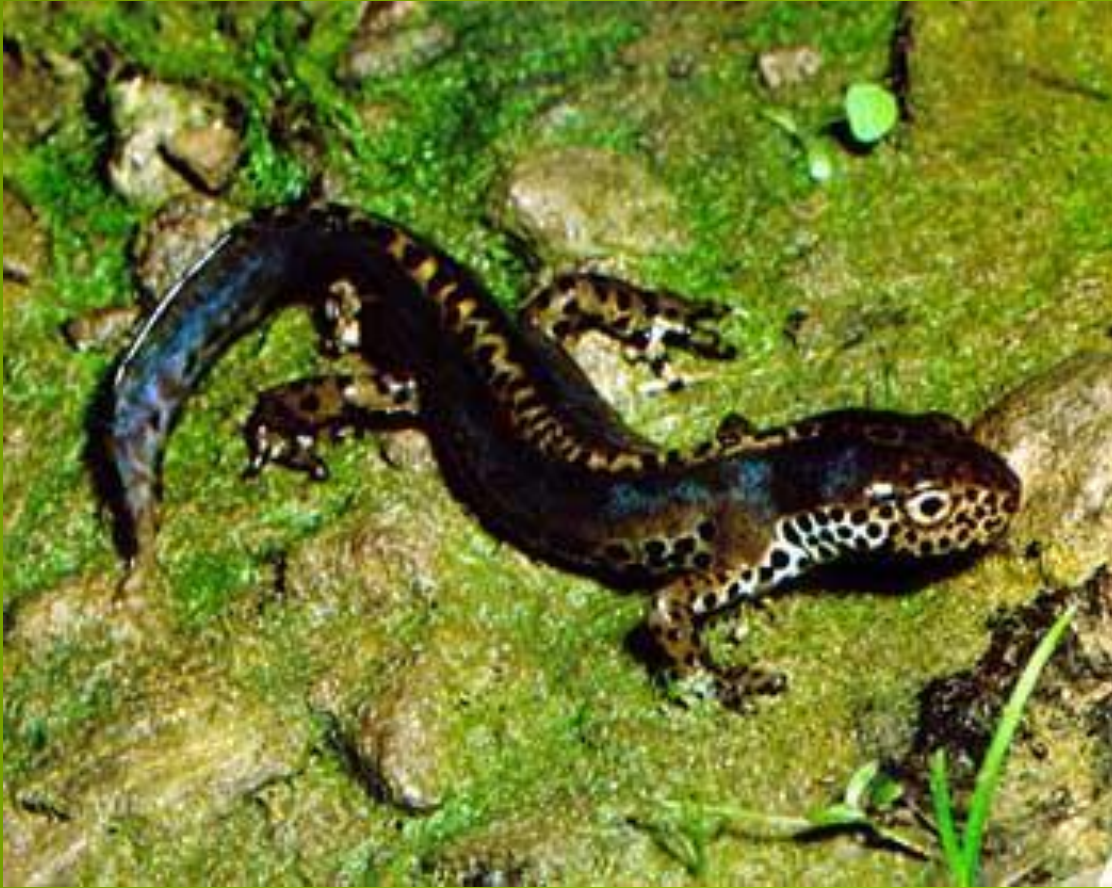
Тигровая саламандра Ambystoma sp.