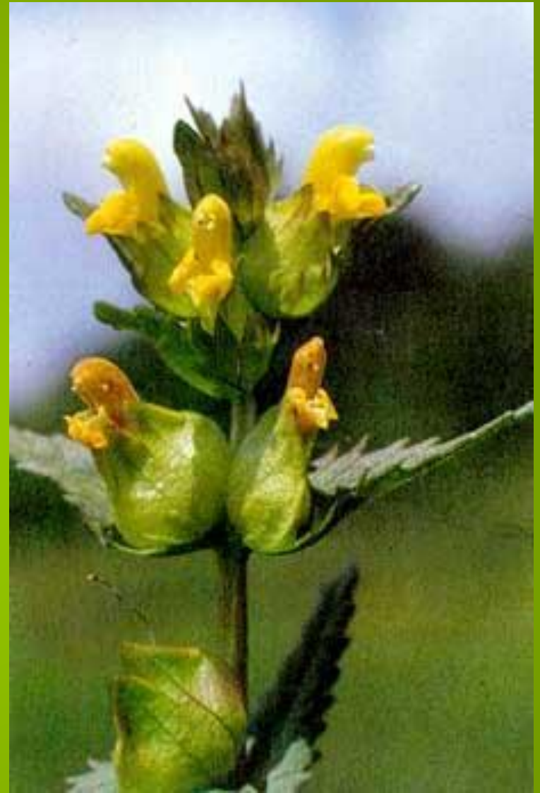
Большой погремок Alectorophus major