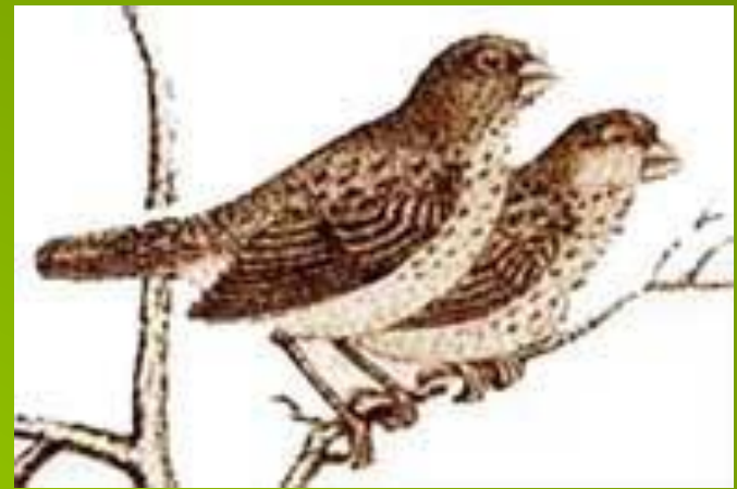
Толстоклювый древесный вьюрок