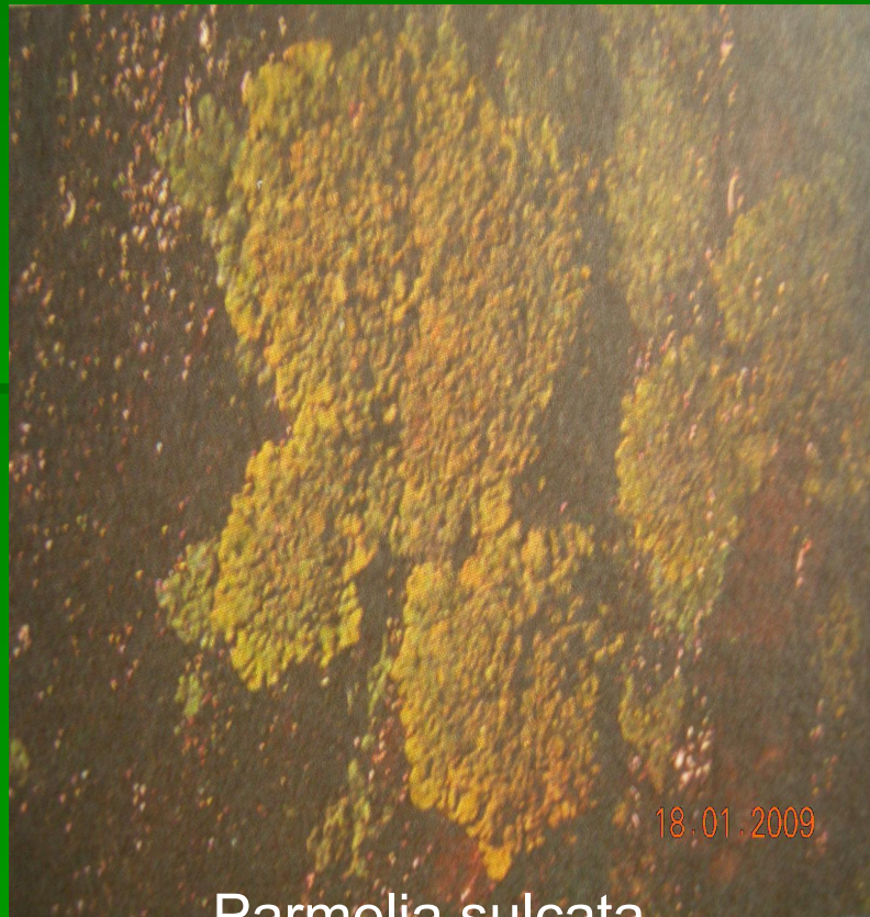
Parmelia sulcata - пармелия бороздчатая