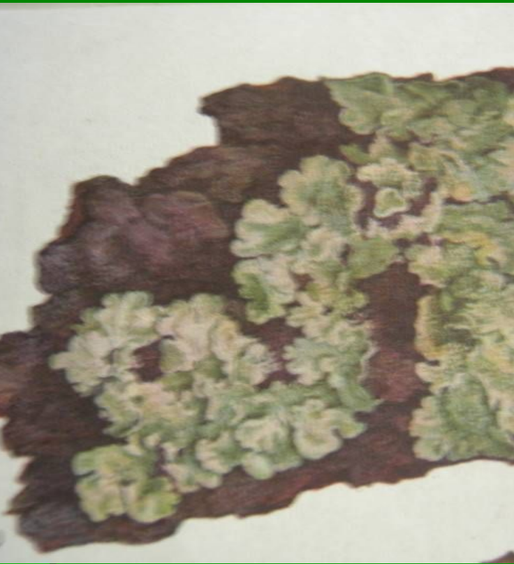
Parmelia caperata Пармелия козлиная