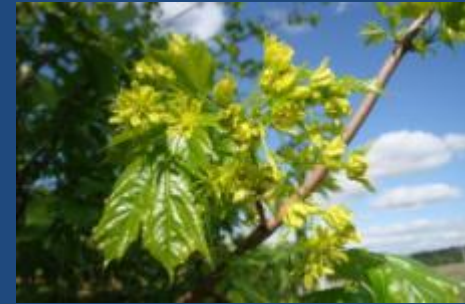
Клён платановидный, или остролистный