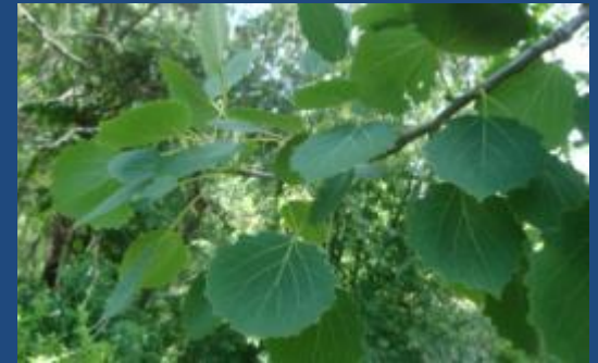
Тополь дрожащий, или осина