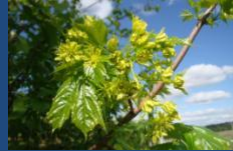
Клён платановидный, или остролистный