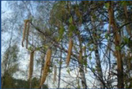
Берёза повислая, или бородавчатая