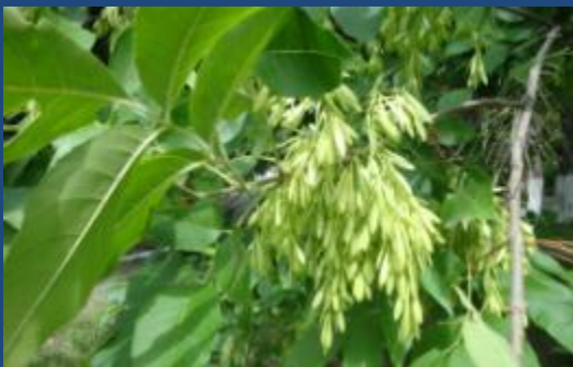
Ясень обыкновенный, или высокий