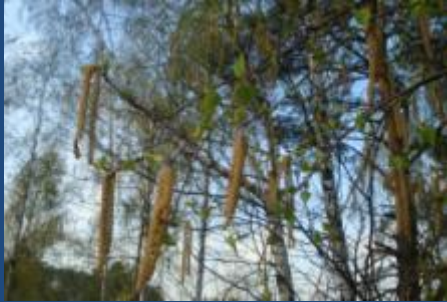
Берёза повислая, или бородавчатая