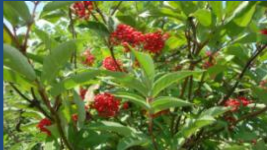
Бузина кистевидная, или красная