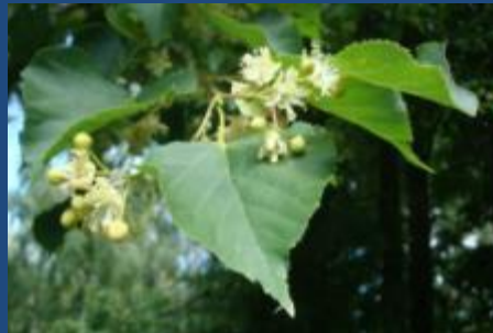
Липа сердцевидная, или мелколистная