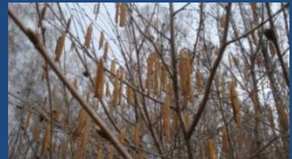
Лещина обыкновенная, или орешник