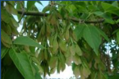
Клён ясенелистный, или американский