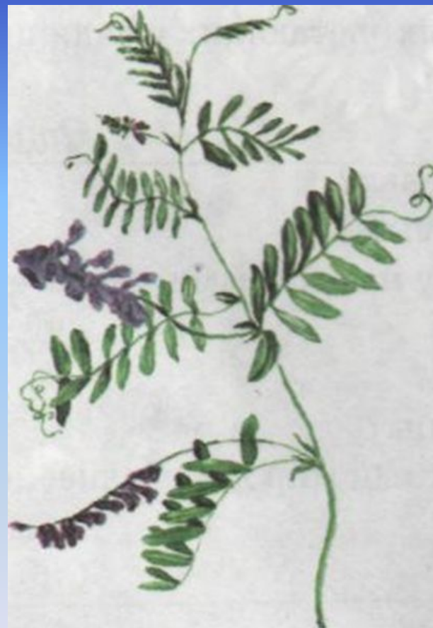
Семена вики (мышинного гороха)