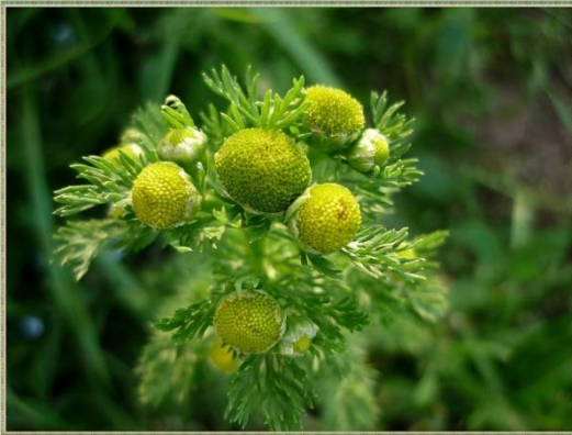
Ромашка душистая - Matricaria matricarioidis

Линней считается создателем научной системы животных и растений. Он предложил называть каждый вид двумя словами на латинском языке, из которых первое было названием рода, а второе - видовое (бинарная номенклатура). Предложенная бинарная номенклатура была принята всеми учеными, ею пользуются и в настоящее время.