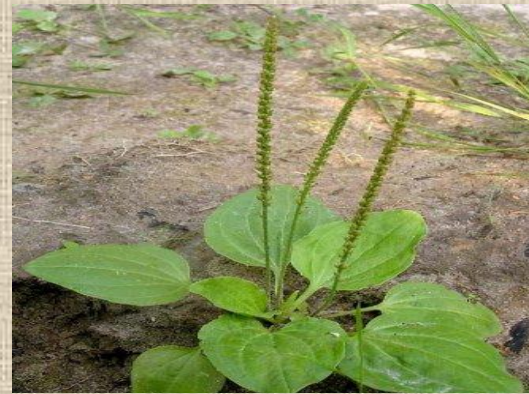
Подорожник большой - Plantago májor

Линней считается создателем научной системы животных и растений. Он предложил называть каждый вид двумя словами на латинском языке, из которых первое было названием рода, а второе - видовое (бинарная номенклатура). Предложенная бинарная номенклатура была принята всеми учеными, ею пользуются и в настоящее время.