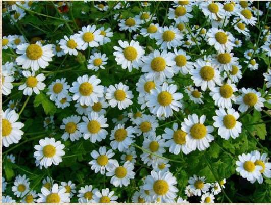
Ромашка аптечная- Matricaria chamomilla