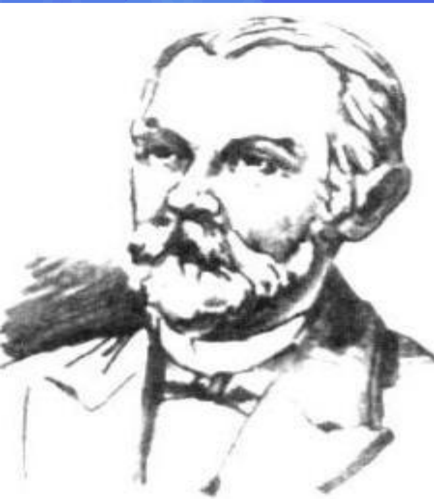
Дмитрий Иосифович Ивановский (1864—1920)